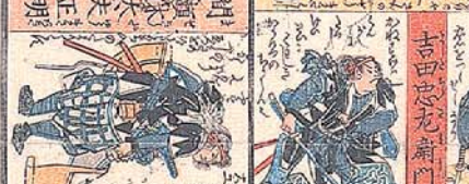
間 頼大夫 正明