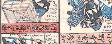
因島 義之助 常雄