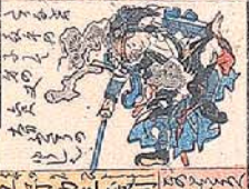
浦 太郎 高直