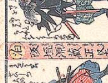
大 星 清 左 衛 門 信 清