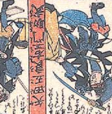
廣 松 謀 六 行 重