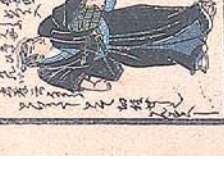
早野 勤平 義直