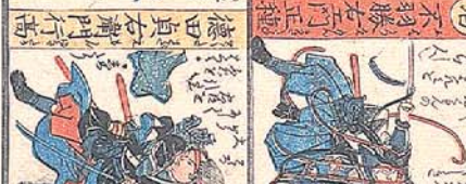
德田 貞右衛門 行高