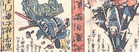
東 大 藏 右衛門 善