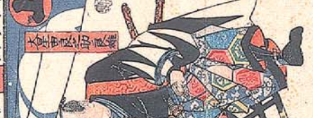
吉田 玄右 重 内