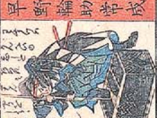
早野 輪助 常成