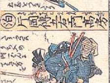
泊 斤四郎 左四郎 高房