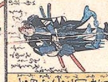
吉 田 定 右 門 善 貞