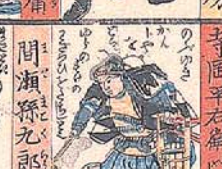
間 瀬 九 郎 正 辰