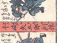
新崎 矢五郎 則休