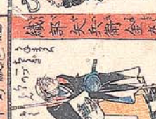
核 野 忠 平 治 次 房