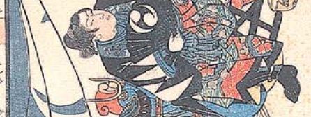
泊 不羽 勝 左 門 正 雄