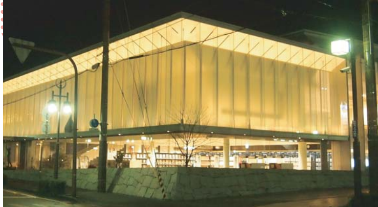
昼と夜で違う表情をみせる 赤穂市立図書館の外観