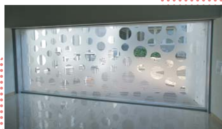
現代アーティスト 草間彌生氏が手がけた 水玉グラスアート 「夜空の銀河」