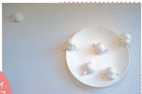
美術作家・奈良美智氏のオブジェ 「メルティング・ムーン」