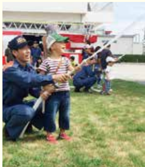
お問合せ 加里屋児童館 TEL.0791-43-2360